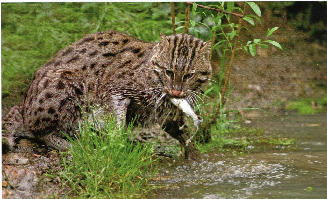
Aunque su dieta pueda ser variada, los peces constituyen una de las presas preferidas del gato pescador.

Para cazar, se aposta en la orilla de un río o estanque y atrapa de un zarpazo a cualquier rana o pez que se le aproxime lo suficiente. Si es necesario, también puede sumergirse, total o parcialmente, para atrapar peces, batracios y aves